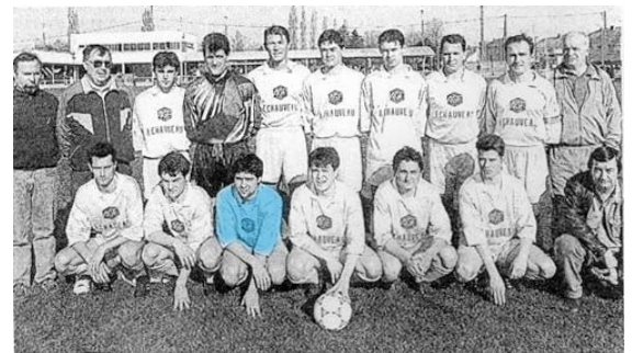
L'équipe de l'AS Saint-Pierre Montrevaault est une spécialiste de la coupe

- Une belle montée dans les 2 ans à venir en DH me ferait regarder à nouveau les pages sports le lundi matin.