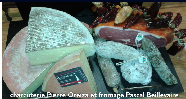
charcuterie Pierre Oteiza et fromage Pascal Beillevaire

IN . SPIRITUEUX . CHARCUTERIE BASQUE . FROMAGERIE . RESTAURATION SUR PLACE